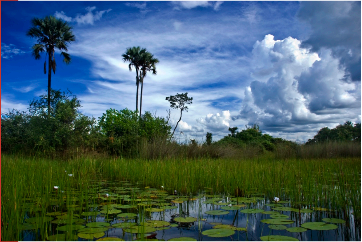
Óshólmar í eyðimörkinni

Okavango óshólmasvæðið er eitt af undrum veraldar. Stórfjótíð samnefnda safnar vatni úr fjöllum Angóla um regntímann og rennur suður í átt til Namibíu og síðan inn í Kalahari eyðimörkina í Botswana. Mörkin er stærsta samfellda sandauðn í Afríku en á afmörkuðum hluta myndast mikil flæmi óshólma og fenjalanda þar