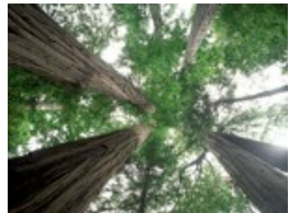
Quis nulluptat. Dui bla