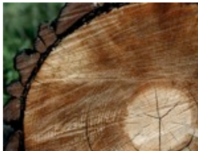
Quis. Dui bla faccumsan ve